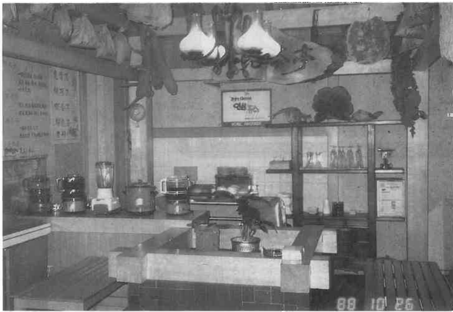
健康薬湯は韓国を代表する特産提供品として好評

値するとの全員の意見でした。の技術を見習う余地があるとし、ボデークリナーでも彼等という声も聞かれました。