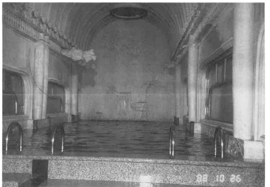
豪華な大理石で造られた温泉プール

日本円との換算目安となります。ホテルの中にあるサウナです。ホテルの宿泊客を対象としているのは当然ですが、比較的グレードの高い高級サウナと言えます。韓国特産の大理石がふんだんに使われていて、王朝風の非常に優雅なたたずまいの中で入浴が楽しめます。造りそのものが大理石主体です。重厚豪華、その構造・設備ともに日本では